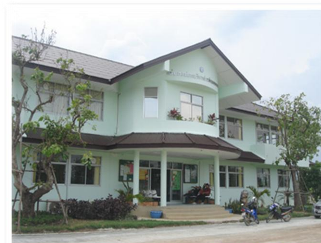
อ.การบริการส่วนตำบลชนงพระ